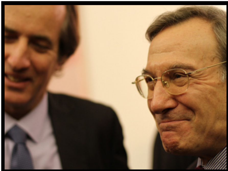
נשיא ה-CNES יאניק ד'סקאטה