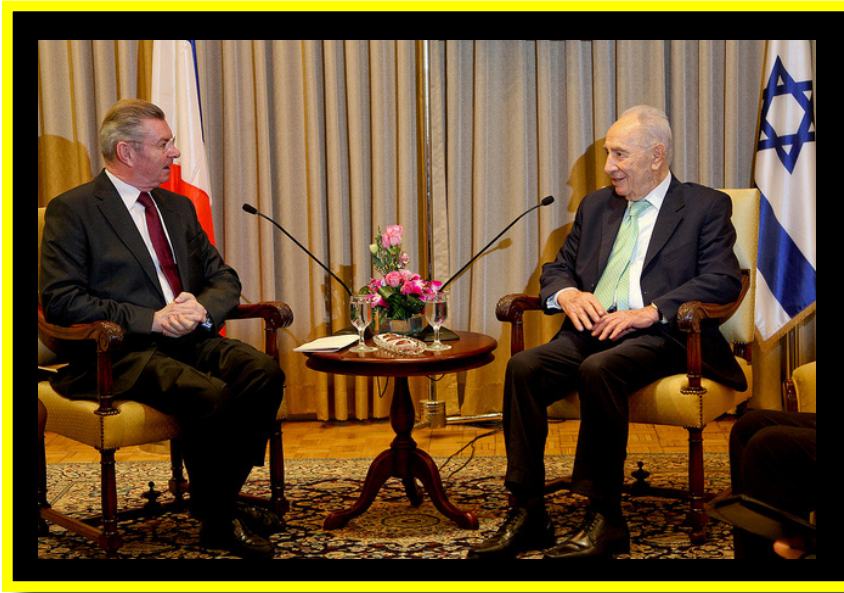
אנרי דה ראנקור בפגישה עם הנשיא שמעון פרס, ירושלים, 23 בינואר 2012